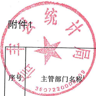
2021年度项目支出绩效自评情况汇总表